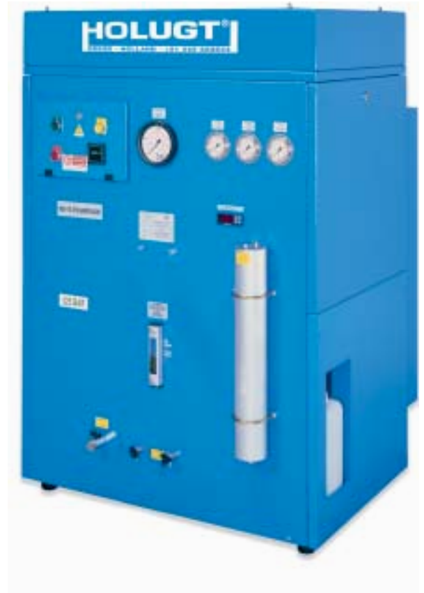
HL220 Super Silent